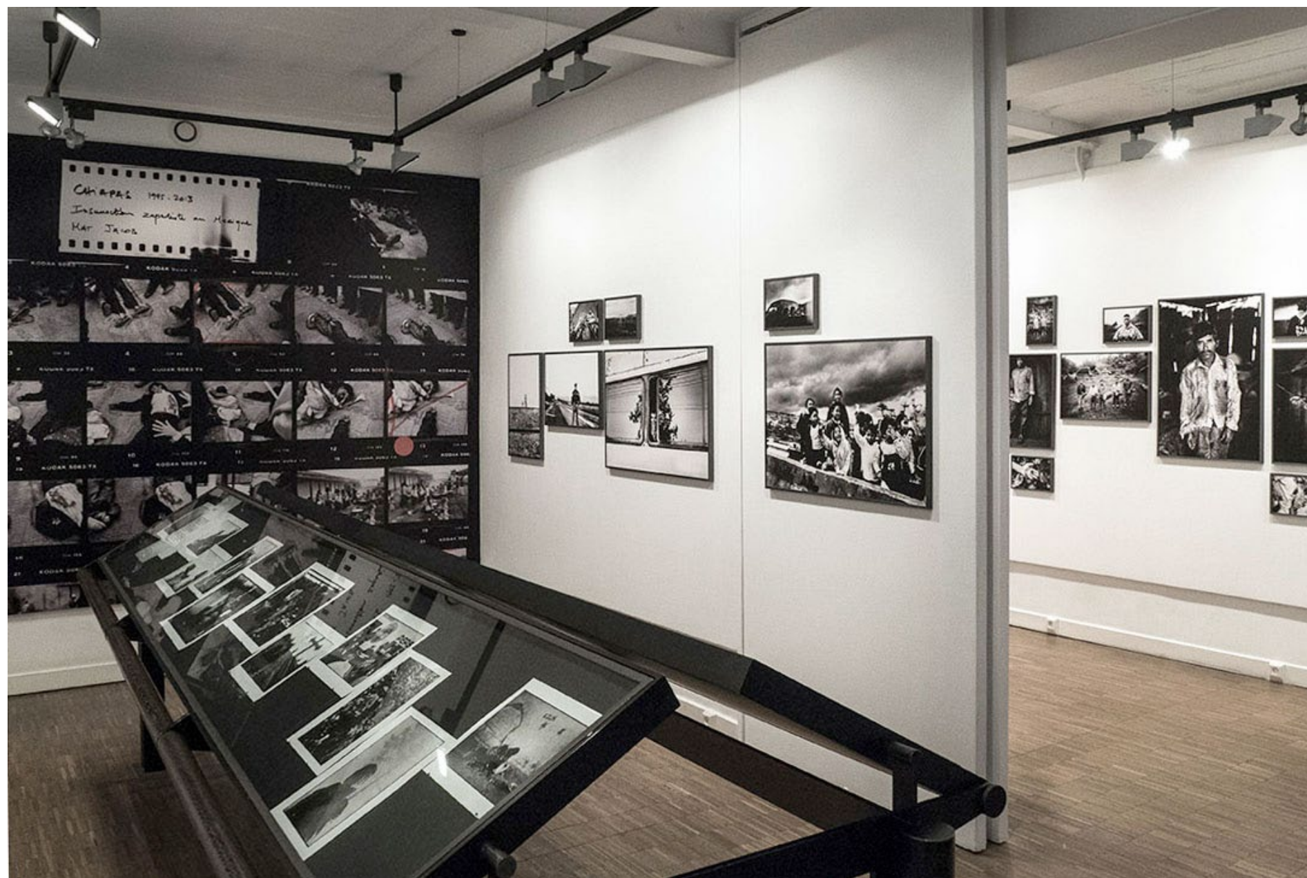
Chiapas, exposée à la galerie Fait & Cause, Paris, en mars avril 2016

Projection d'un film 15 mn, réalisation Mat Jacob